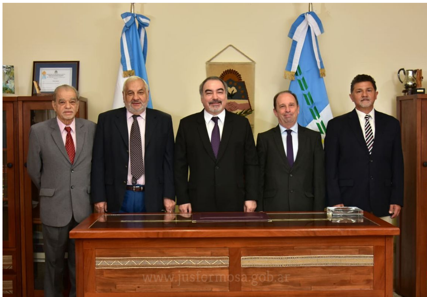
Autoridades del Superior Tribunal de Justicia